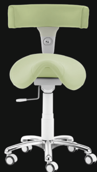
"ED 1000 Plus"